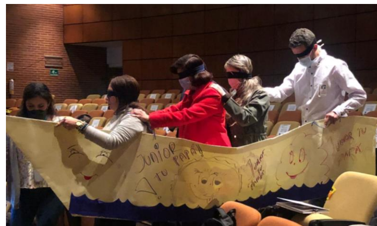
Se desarrolló con éxito la "Jornada de pensamiento estratégico"