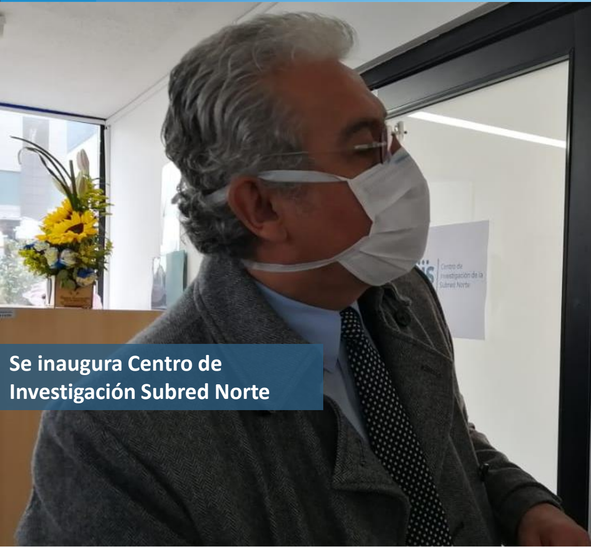
Se inaugura Centro de Investigación Subred Norte