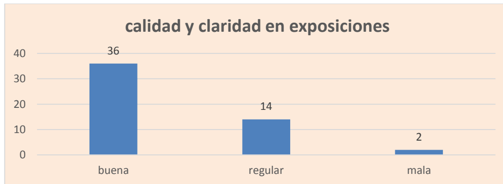
Tabla 2. Evaluación calidad y claridad en temas expuestos en COVE Local Suba y Engativá, Marzo 2019