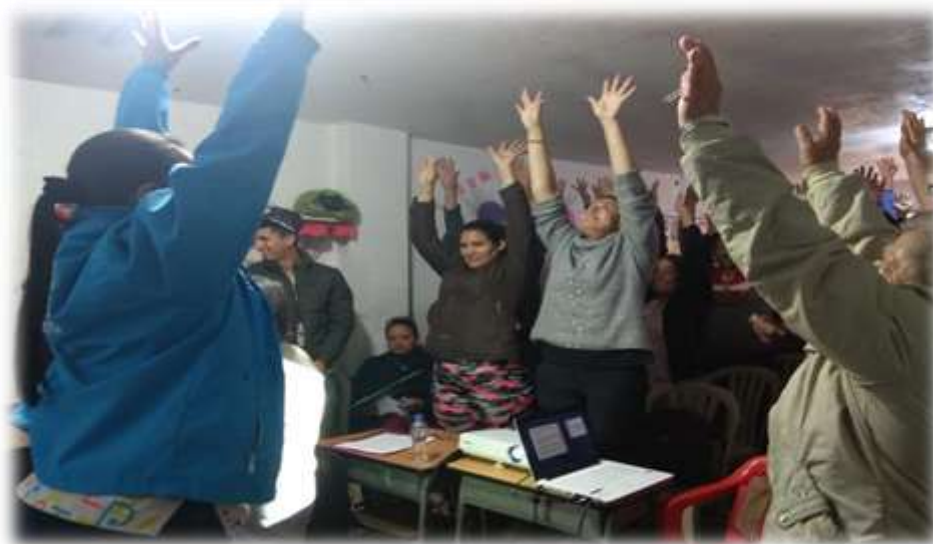
Fuente: Fotografía tomada Equipo VSPC-COVECOM- septiembre 2019 Localidad de Suba