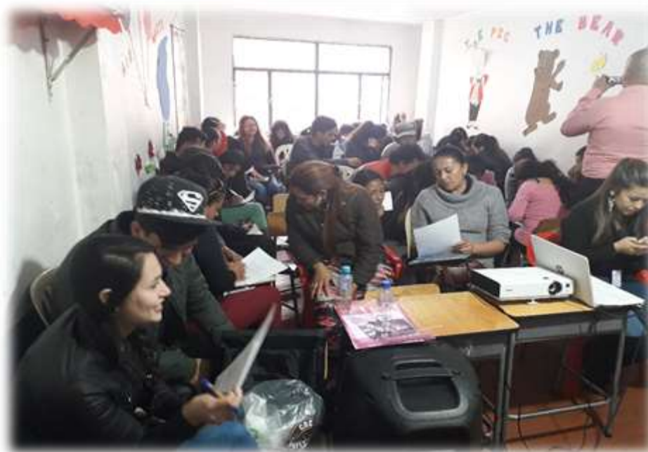
Fuente: Fotografía tomada Equipo VSPC-COVECOM- septiembre 2019 Localidad de Suba