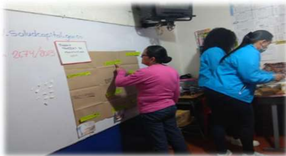
Fuente: Fotografía tomada Equipo VSPC-COVECOM- septiembre 2019 Localidad de Suba