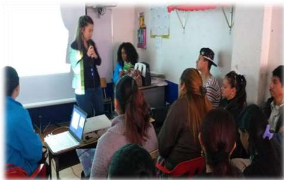
septiembre 2019 Localidad de Suba