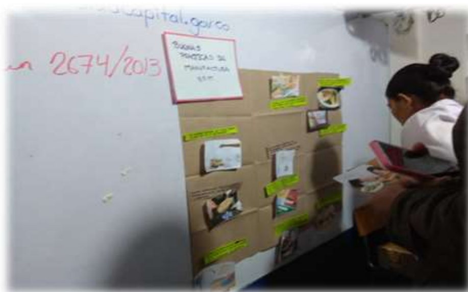
Fuente: Fotografía tomada Equipo VSPC-COVECOM- septiembre 2019 Localidad de Suba