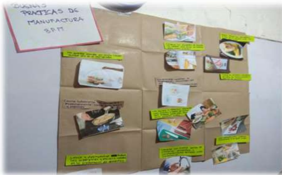
Fuente: Fotografía tomada Equipo VSPC-COVECOM- septiembre 2019 Localidad de Suba