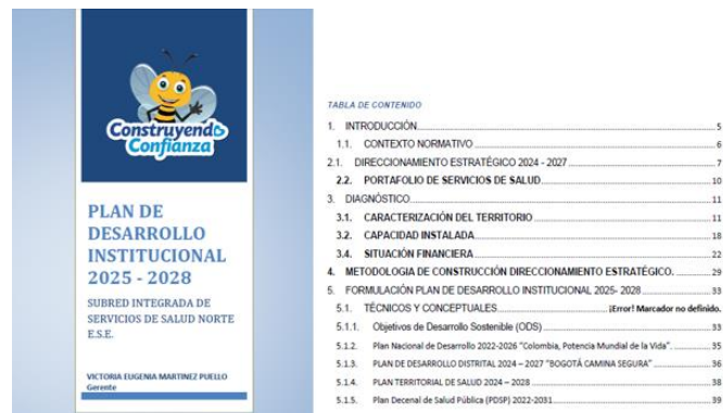
Imagen No. 1 Plan de desarrollo Institucional PDI 2025-2028 Subred Norte

Dentro de la información publicada en la sede electrónica de la Subred Norte por la Oficina de Desarrollo Institucional, se encuentra el documento: “ Plan_desarrollo_institucional_2025-2028 ”.