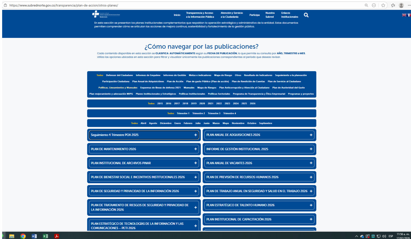
Imagen No. 2 Sede electrónica - Subred Norte

Se recomienda realizar la publicación del monitoreo realizado al PDI de la vigencia 2025, en la sede electrónica de la Subred.